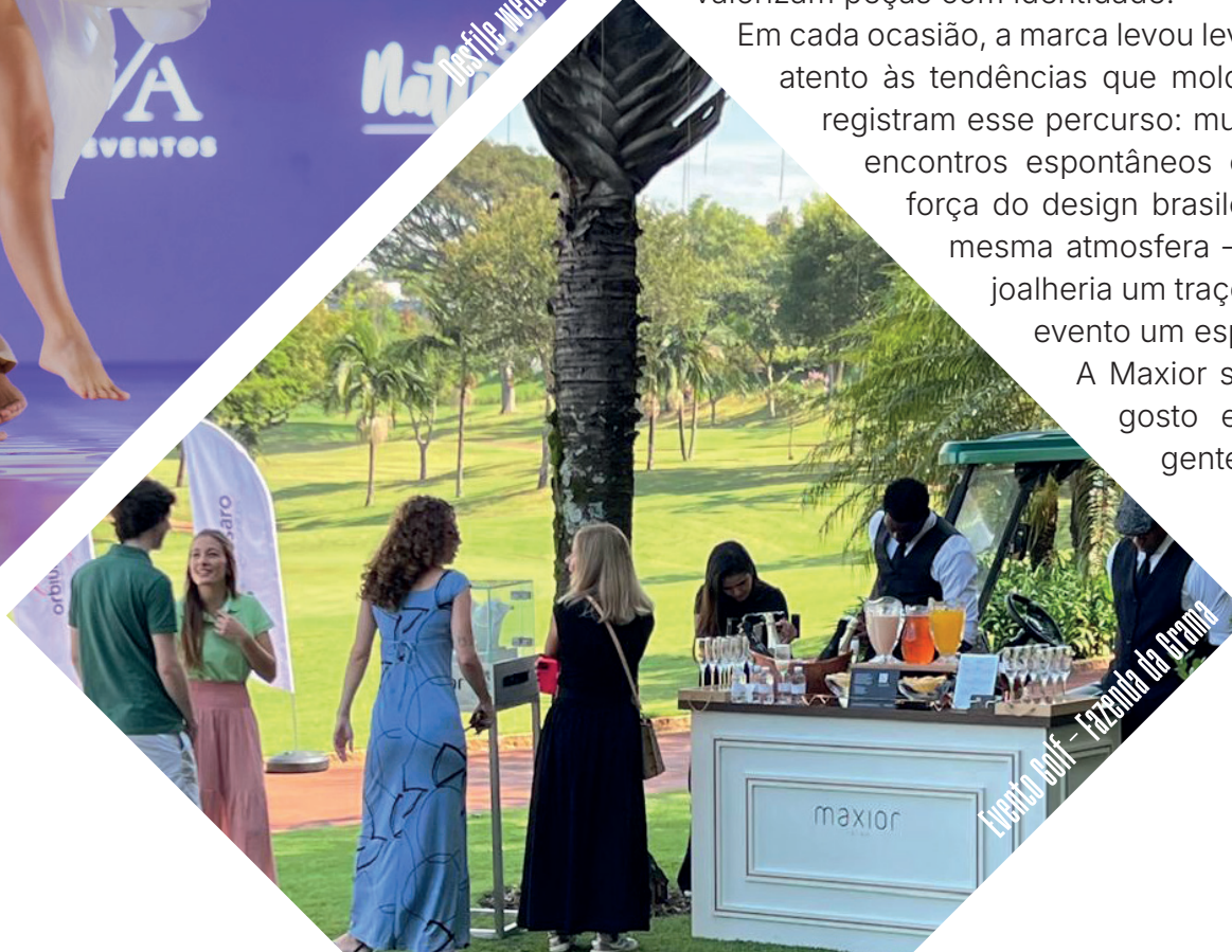
Evento buff - Fazenda da Gramma