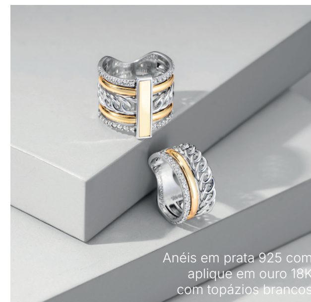
Anéis em prata 925 com aplique em ouro 18K com topázios brancos

You é sobre sentir-se bem. A Linha de joias de prata mistura o clássico e o novo, o simples e o marcante, sem medo de ser múltipla.