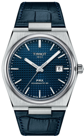
TISSOT PRX PowerMatic 80 Referência: R-TI-00252

Relógios que traduzem precisão, estilo e presença. Escolhas que combinam com o homem contemporâneo, entre a sofisticação do clássico e a força do design moderno.