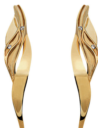
7. Pulseira da Coleção Stand By Me 8. Brinco da Coleção Lapa 9. Brinco da Coleção Nara 10. Brinco da Coleção Sand 11. Anel da Coleção Vibrante