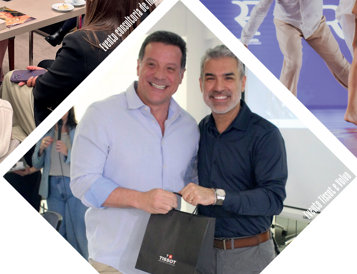
Evento Tissot e Volvo