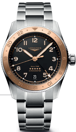
LONGINES Spirit Zulu Time 1925 Automático 39MM Referência: R-LO-00053

A elegância do tempo se revela em detalhes: linhas puras, engenharia impecável, materiais nobres e personalidade. Da flexibilidade do Tissot PRX ao caráter esportivo do TAG Heuer Formula 1, cada peça expressa uma forma de viver o agora. O Mido renova o desejo pelo design retrô-chic, enquanto o Longines Spirit Zulu Time ilumina o pulso de forma atemporal. Já o Victorinox Dive Pro traduz resistência e força. Cinco estilos, uma mesma verdade: o luxo é carregar uma história em cada segundo.