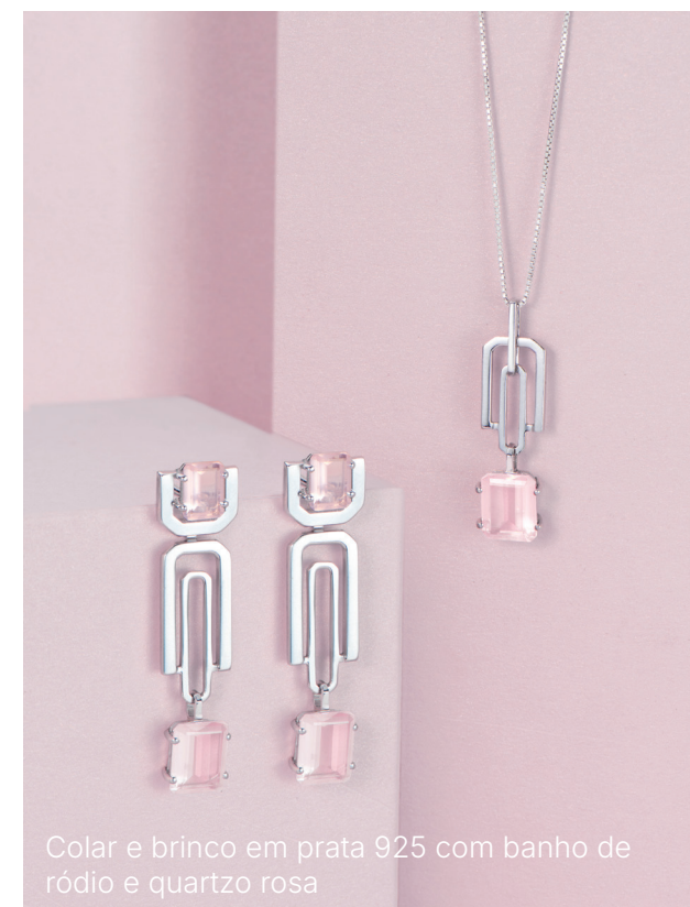
Colar e brinco em prata 925 com banho de ródio e quartzo rosa