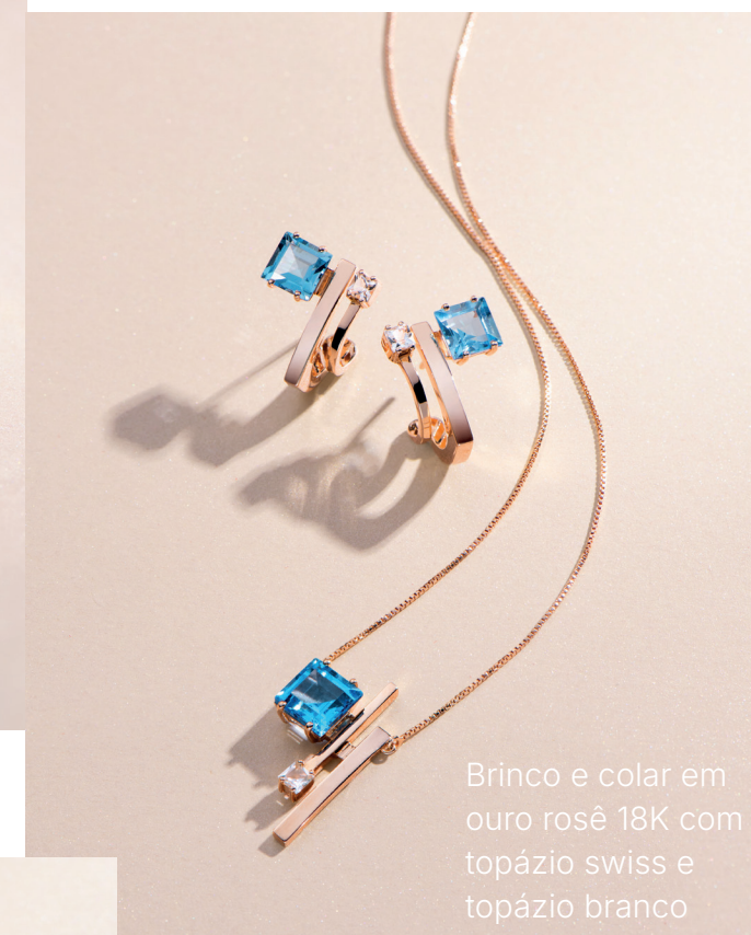
Brinco e colar em ouro rosê 18K com topázio swiss e topázio branco