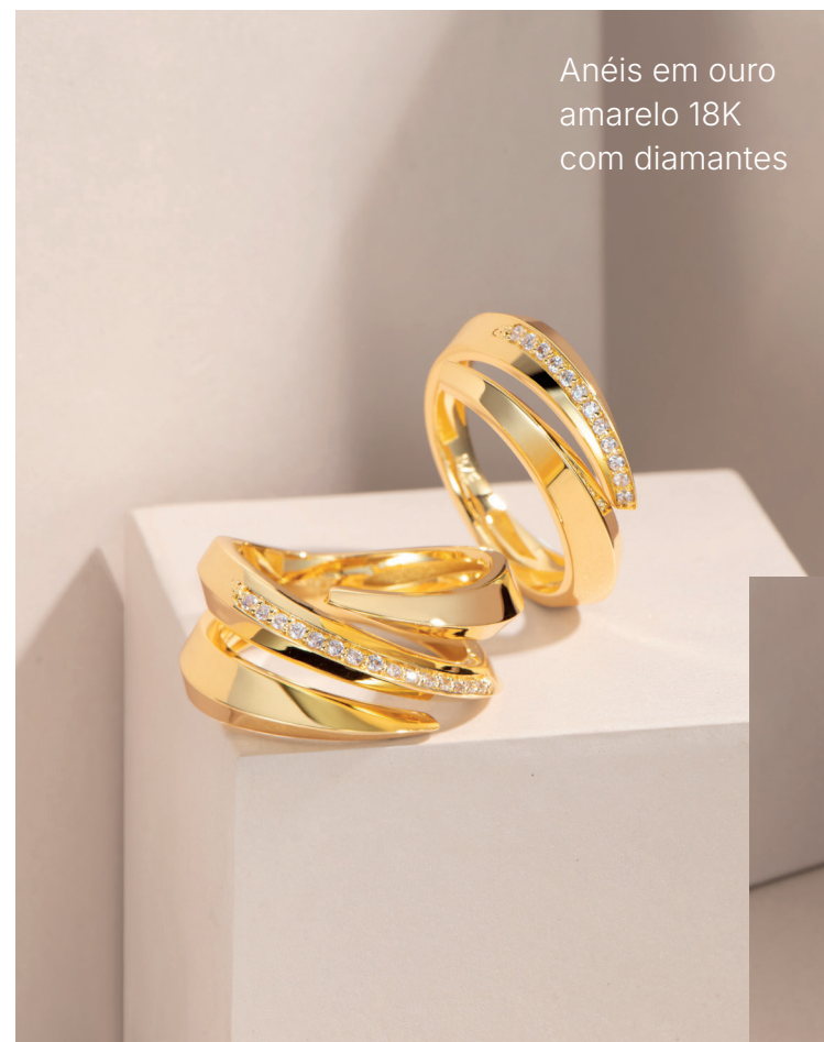
Anéis em ouro amarelo 18K com diamantes