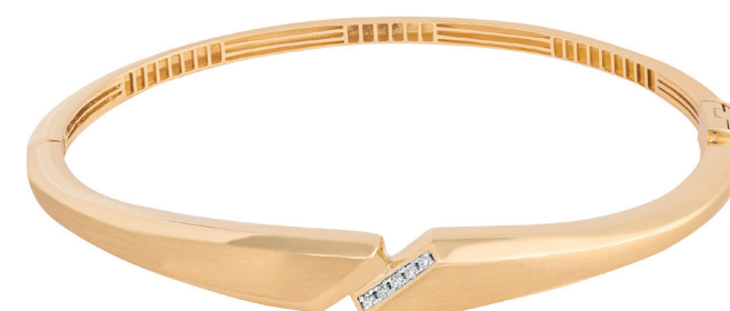
12. Colar da Coleção True Love 13. Brinco da Coleção Kyoto 14. Pulseira da Coleção Dádiva 15. Anel da Coleção Josephine