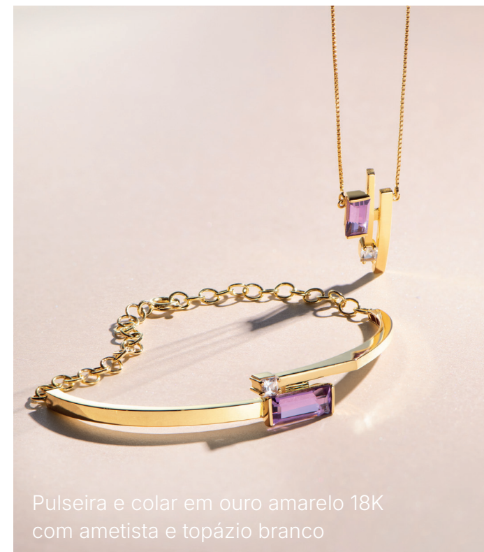
Pulseira e colar em ouro amarelo 18K com ametista e topázio branco