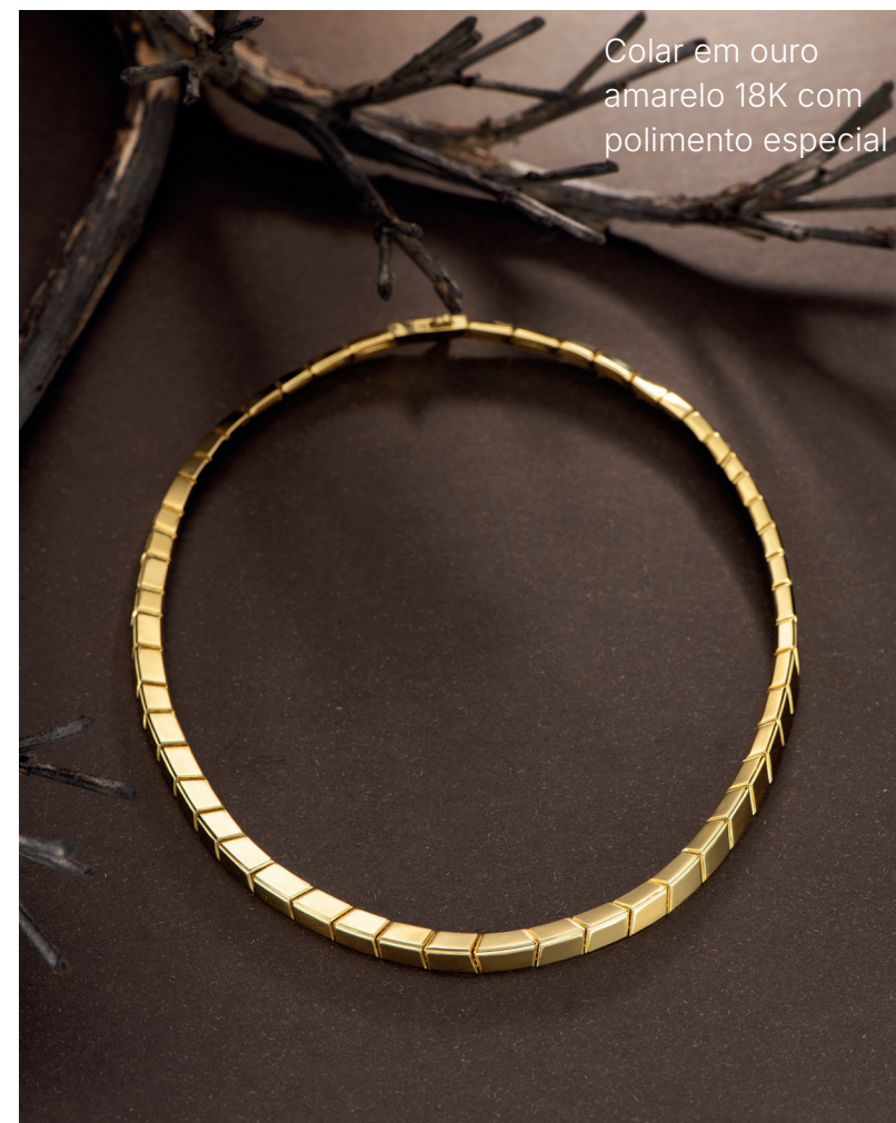
Colar em ouro amarelo 18K com polimento especial