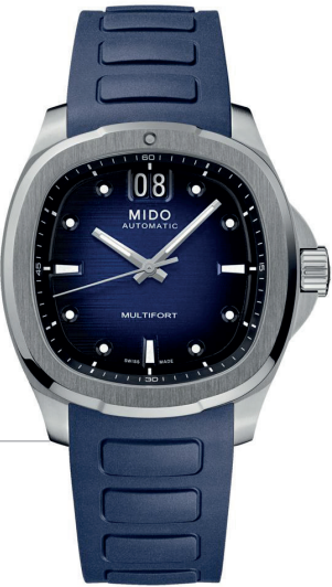
MIDO Multifort Tv Bigdate 40mm Referência: R-MI-00086