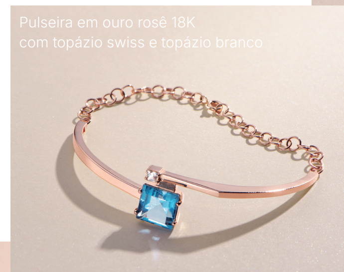
Pulseira em ouro rosê 18K com topázio swiss e topázio branco