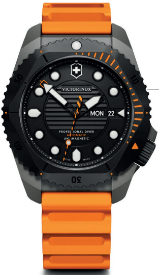
VICTORINOX Masculino Dive Pro Automático Titânio Laranja Referência: R-VT-00221