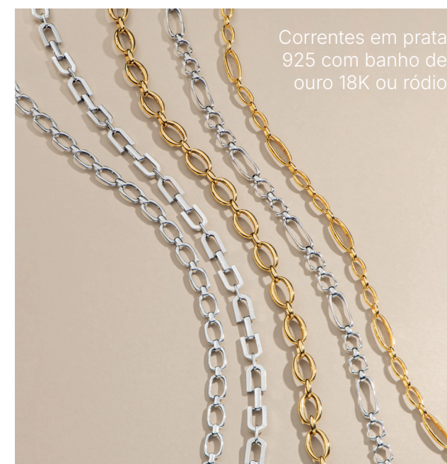
Correntes em prata 925 com banho de ouro 18K ou ródio

Existe um tipo de brilho que não depende de holofotes: nasce da alma, da confiança e do agora. YOU traduz esse sentir em joias que sussurram elegância e revelam presença. A coleção YOU celebra o conforto da autenticidade, o prazer de se sentir bem no próprio corpo, com joias em prata que traduzem leveza, elegância e poder silencioso. Soft Glow reflete o feminino em sua versão