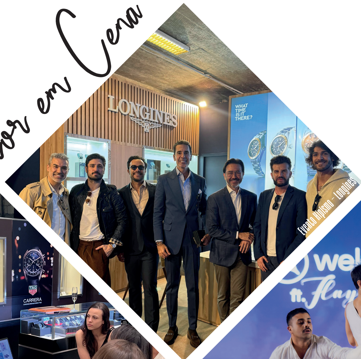
Evento Hipismo - Longines