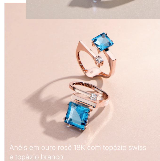
Anéis em ouro rosê 18K com topázio swiss e topázio branco