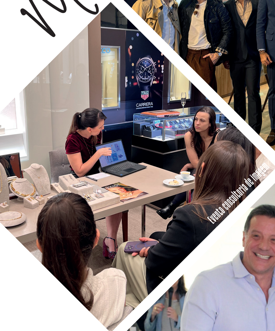
Evento consultoria de imagem