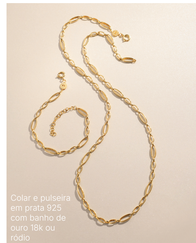
Colar e pulseira em prata 925 com banho de ouro 18k ou ródio