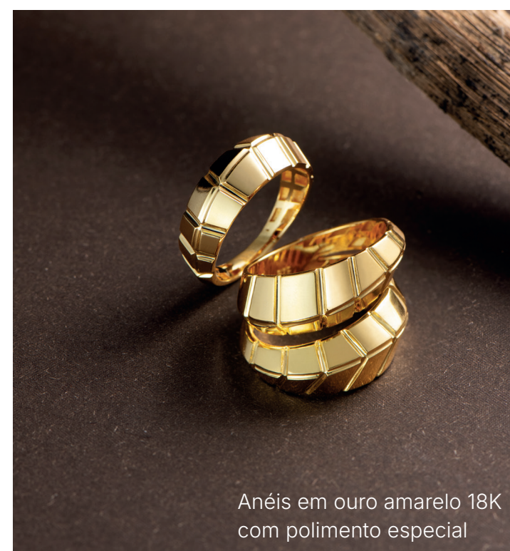
Anéis em ouro amarelo 18K com polimento especial