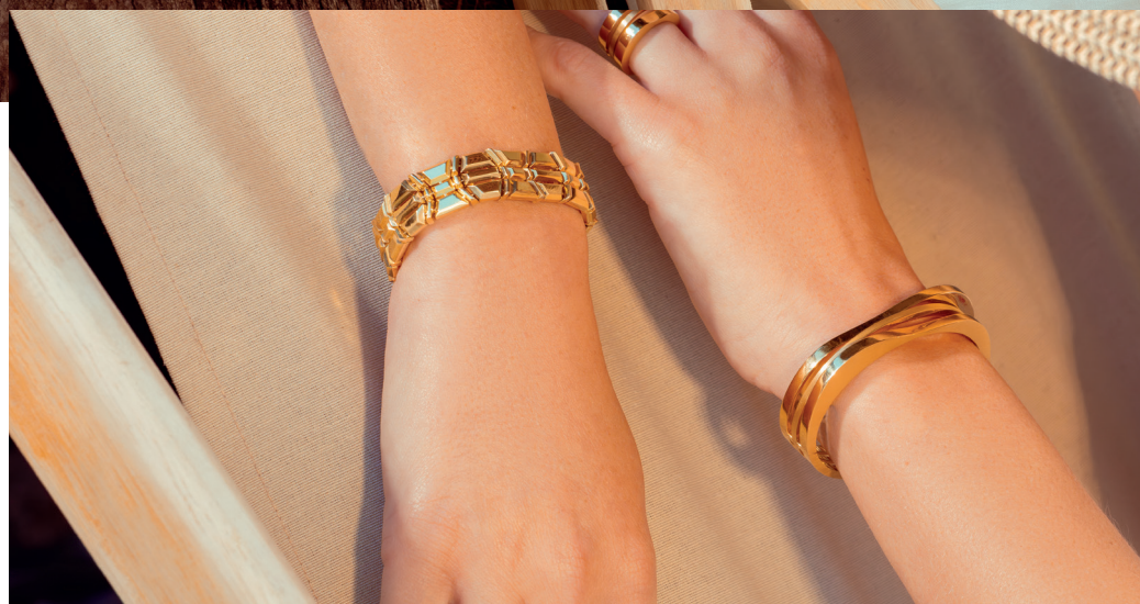
Coleções Vibrante e Radiance