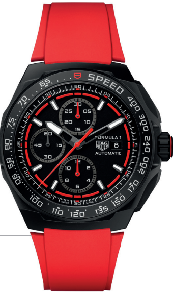
TAG HEUER Formula 1 Chronograph Automático 44MM Referência: R-TG-00307