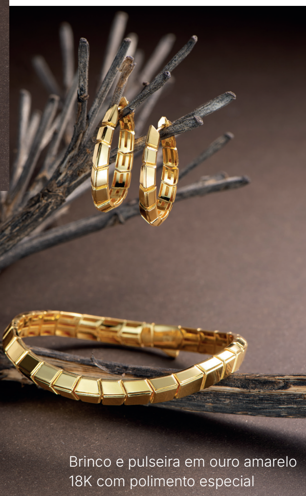
Brinco e pulseira em ouro amarelo 18K com polimento especial